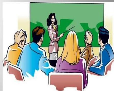
Рисунок 2 — Формы взаимодействия семьи и школы в воспитательном процессе