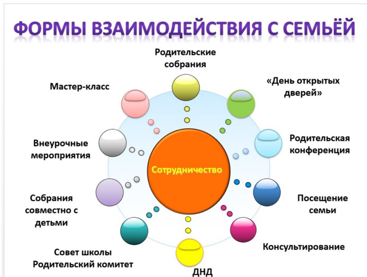
Рисунок 3 — Формы взаимодействия семьи и школы в воспитательном процессе

Одним из ключевых факторов успеха является взаимодействие семьи и школы, который представляет собой процесс совместной деятельности, направленной на согласование целей и методов воспитания детей. Это сотрудничество не только создает условия для самореализации ребенка, но и формирует мотивацию к учебе, что подтверждается исследованиями в области педагогики [30]. Участие родителей в учебно-воспитательном процессе позволяет гармонизировать взаимоотношения между учителями и учениками, а также между семьей и образовательным учреждением.