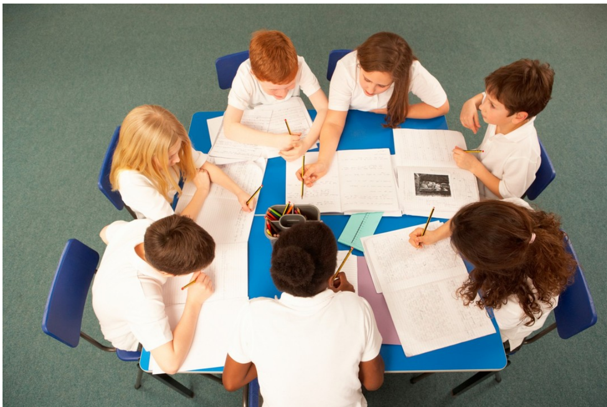
Рисунок 1 — Групповая работа на тематическом уроке для адаптации обучающихся

Особое внимание стоит уделить тематическим урокам как одной из эффективных практик в духовно-нравственном и патриотическом воспитании обучающихся. Тематические уроки представляют собой целостную форму организации учебно-воспитательного процесса, где фокусируется внимание на конкретной теме. Это нужное пространство для интеграции знаний из различных дисциплин. В отличие от традиционных занятий, такие уроки могут быть более познавательными и результативными, так как они охватывают как дидактические, так и воспитательные цели [26].