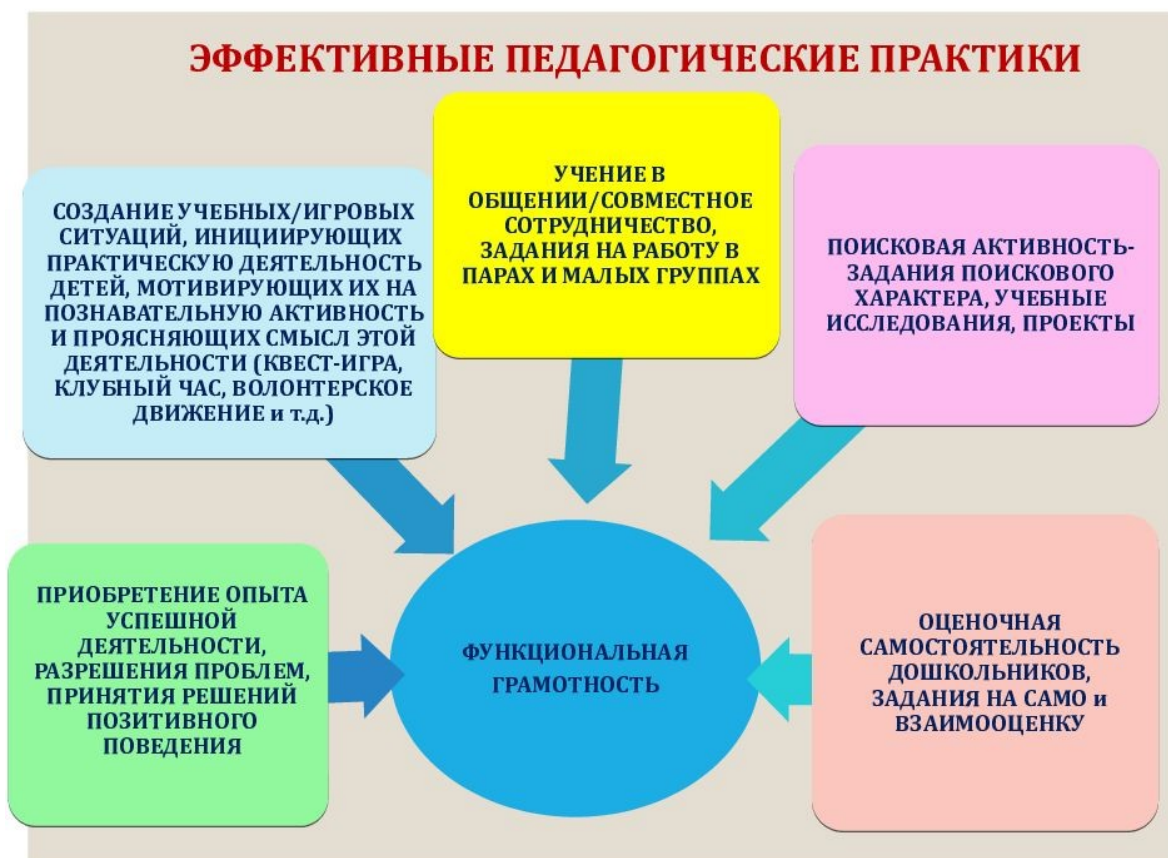
Рисунок 4 — Эффективные педагогические практики для духовно-нравственного воспитания

Для успешной реализации рассмотренных практик необходимо учитывать несколько ключевых аспектов. Важно создать условия для активного вовлечения обучающихся в образовательный процесс. Педагоги могут использовать методы, предполагающие большую самостоятельность студентов. Это не только способствует развитию критического мышления, но и повышает мотивацию к обучению [11].