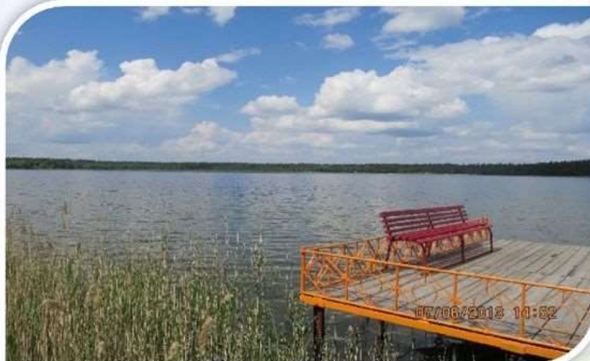
Белое озеро .