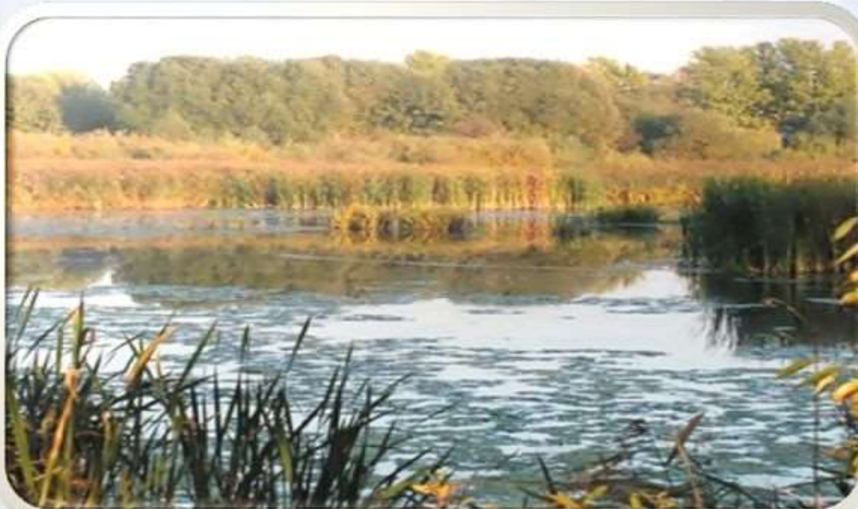
Черное озеро .