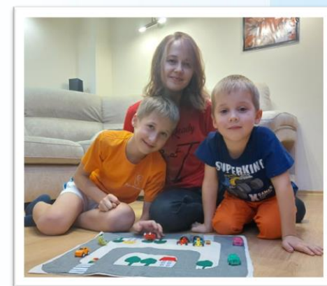
Акция «Сидим дома с пользой» (изготовление дидактических игр)