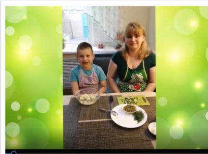
«Вкусно и полезно»