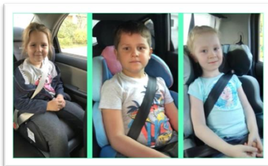
Флешмоб «Пристегни самое дорогое»