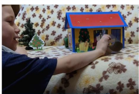
Семейная программа «В гостях у сказки»