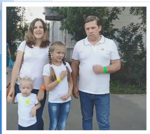
Челлендж «Наша семья соблюдает ПДД»