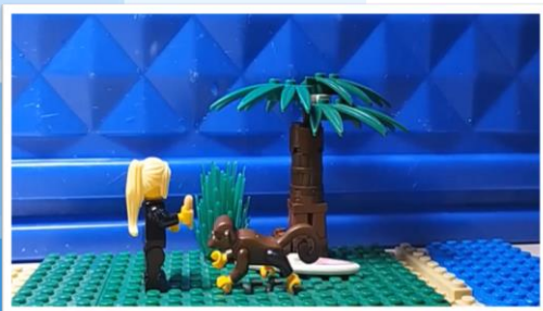
Мультфильм из конструктора Лего