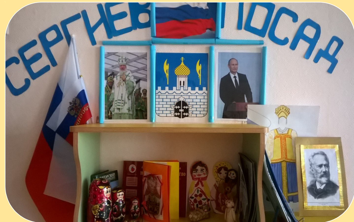
Уголок по ознакомлению с родным краем в группе

Архитектура города всегда важна, а значит без строителей нам не обойтись.