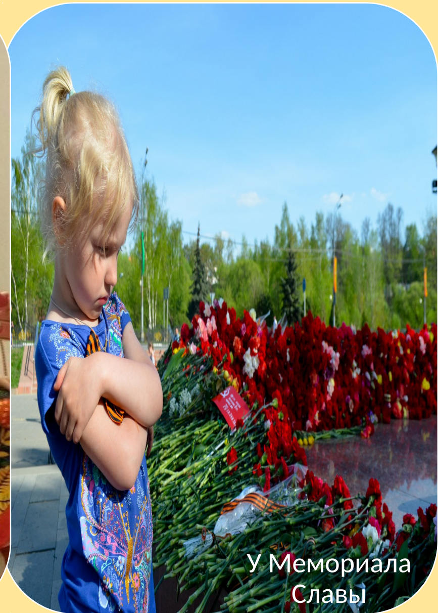
У Мемориала Славы